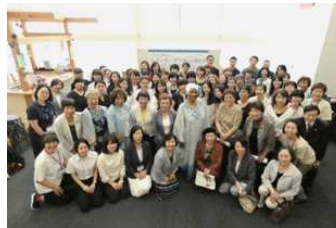
ヌカカ事務局長と参加者のみなさん