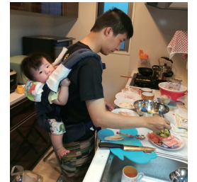
平成30年度グランプリ作品