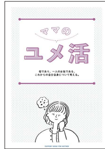
ライフプランニング支援冊子 クレオ大阪ほかで配布

本事業には、大人の学びの視点から大阪市立大学が参画します。再就職支援では大阪マザーズハローワークが、eラーニング運営では女性が活躍する企業として表彰を受けた株式会社プロアシストが参画し、連携を図りながらそれぞれの強みを生かして、受講者のサポートを行っています。事業の詳細は財団ホームページをご覧ください。