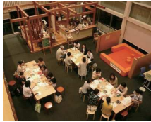
お仕事女子の放課後サロン

女性のキャリア形成をサポートする「ハッピーキャリアプログラム」や男性向けの「イクメン写真コンテスト」など、年齢・性別・ライフステージに合わせてさまざまな研修を開催しています。