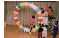
クレオ大阪中央フェスタ