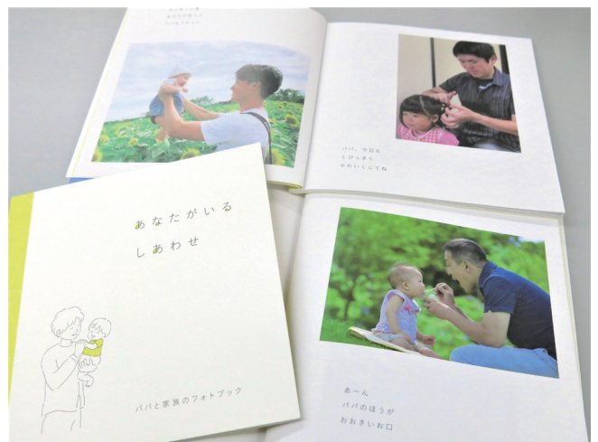
パパと家族のフォトブック「あなたがいるしあわせ」より

10周年を迎えた2020年度は、文科省事業を活用し、歴代の受賞作品32点を掲載したフォトブックを制作しました。市内の3ヶ月検診などで6千冊を配布し、家族や友人と育児について話すきっかけとなるツールとして活用を呼び掛けました。